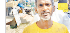
मुलाना। ठगी का शिकारधर्मराज।

आईडीबीआई बैंक के एटीएम से नगदी निकलवाने गया था