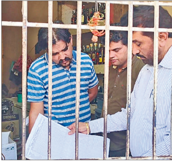
पानीपत। सीएफ फ्लाइंग की टीम शराब के अवैध टेके की जांच करते हुए।

मुख्यमंत्री के उड़न दस्ते यानि सीएफ फ्लाइंग ने पानीपत में शराब के अवैध कारोबार पर नकेल कसते हुए शनिवार को गांव पसीना खुर्द रोड पर बिना लाइसेंस के चल रहे शराब टेके पर छापा मारकर बड़ी मात्रा में बिक्री के लिए रखी गई शराब की बड़ी खेप बरामद की। इधर, सीएम फ्लाइंग जैसे ही टेके पर पहुंची तो टेके का सेल्समैन फरार हो गया। हालांकि सीएम फ्लाइंग की टीम ने सेल्समैन को पकड़ने का प्रयास किया, लेकिन सड़क पर राहियों की भीड़ अधिक होने का फायदा उठा कर सेल्समैन फरार हो गया। सीएम फ्लाइंग यूनिट