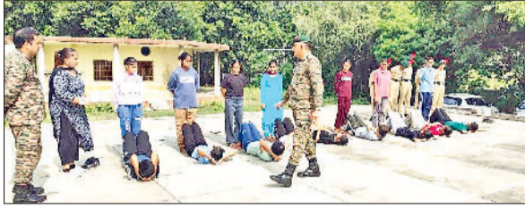
बराड़ा। एनसीसी की चयन प्रक्रिया में भाग लेती हुई छात्राएं।