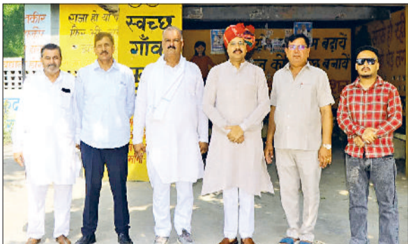
नीलोखेड़ी। खंड के सुल्तानपुर गांव में आयोजित में मौजूद हरियाणा ग्रामीण विकास संस्थान के पदाधिकारी व सदस्य।