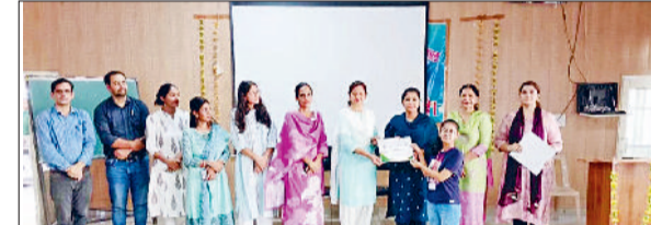
करनाल। छात्रा को सर्टिफिकेट वितरित करते हुए सीजेएम।