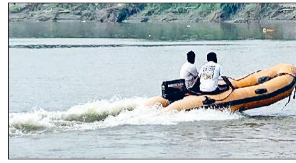
पानीपत। यमुना के पानी में लापता की तलाश करती यूपी पुलिस।